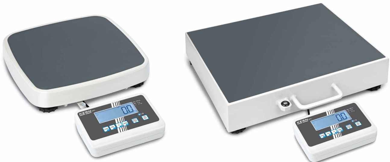
KERN MPC 250K100M

Kompakte Personenwaage mit Medizinzulassung für den professionellen Einsatz in der medizinischen Diagnostik, optional mit Eichung